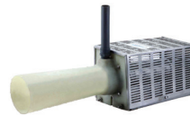
Fish pond Aeration

পুকুরে মৎস্য চাষের জন্য উপযোগী ও অক্সিজেন সরবরাহের জন্য আমাদের রয়েছে বিজিফ্লো ব্র্যান্ডের বিদ্যুৎ সশ্রয়ী ফিশ-পন্ড পাম্প। পাম্পটির বায়ু গ্রহণ ক্ষমতা ঘন্টায় ১২ ঘনমিটার যা পানিতে সর্বোচ্চ ৮০ ঘনমিটার পর্যন্ত প্রবাহ সৃষ্টি করে। এই ফিশ-পন্ড পাম্প আপনার মৎস্য চাষকে সফল করবে বলে আশা করা যায়।