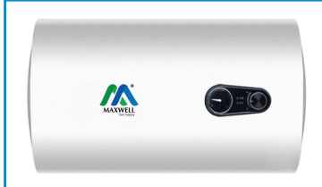
Model: X3-40L Dimension: 385x635mm

শীতের সময় গোসলে, নিত্য প্রয়োজনে গরম পানির প্রয়োজন বেড়ে যায়। ম্যাক্সওয়েল পানির হিটার হতে পারে আপনার একমাত্র সমাধান। স্বয়ংক্রিয় থার্মোস্ট্যাট ও পানির তামপাত্রা নিয়ন্ত্রণে সুবিধা সম্বলিত বিভিন্ন মডেলের ম্যাক্সওয়েল পানির হিটার আপনার জীবনযাত্রাকে করবে আরামদায়ক।