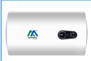
Model: X3-30L Dimension: 385x525mm