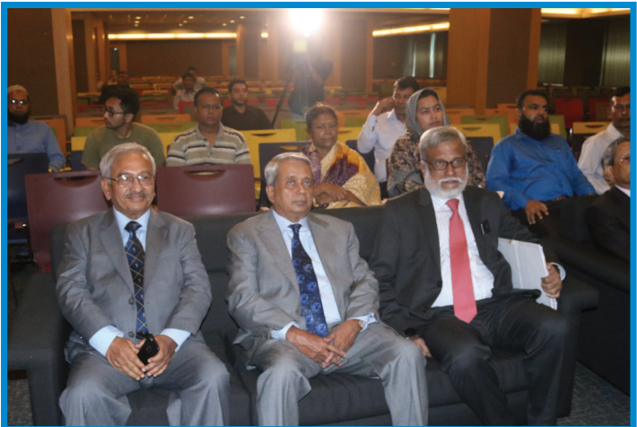
হিল প্লান্টেশন লিমিটেডের সম্মানিত পরিচালকগণ