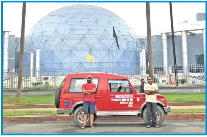
দেশীয় বৈদ্যুতিক গাড়ি নির্মাতা প্রতিষ্ঠান অ্যাডভান্স ডায়নামিকস লিমিটেড (এডিএল) দূষণমুক্ত পরিবহন এবং জীবনযাত্রার মান উন্নয়নের

লক্ষ্যে দেশে তৈরি প্রথম সৌরবিদ্যুত চালিত গাড়ি তৈরি করেছে। গাড়িটি প্রতিবার পূর্ণ চার্জে প্রতি ঘণ্টায় ৬০ কিলোমিটার গতিতে, সৌর-বিদ্যুৎসহ ১৮০ কিলোমিটার চলাচল করতে পারে। এডিএলের মোটর স্পোর্টস ব্র্যান্ড টাঙ্গুয়ার রেসিং টিম এই গাড়ি নিয়ে টেকনাফ থেকে তেঁতুলিয়া পর্যন্ত ২০০০ কিলোমিটার ভ্রমণ করে। এই আয়োজনের অন্যতম সহযোগী প্রতিষ্ঠান ছিল পেডরোলো এনকে লিমিটেড। আগামী বছর বাংলাদেশ থেকে জীবাশ্ম জ্বালানিবিহীন গাড়ির প্রতিযোগিতায় অংশ নেবে টাঙ্গুয়ার রেসিং টিম। দেশের প্রথম গাড়ি হিসেবে এইটি ডে রেস (80 Day Race) নামক বৈদ্যুতিক গাড়ি পরিভ্রমণের আন্তর্জাতিক প্রতিযোগিতায় প্রতিদ্বন্দ্বিতা করবে বাংলাদেশের পতাকা নিয়ে। যেখানে তারা প্রতিদ্বন্দ্বিতা করবে মার্কিন যুক্তরাষ্ট্র, যুক্তরাজ্য, ফ্রান্সসহ বিশ্বের বিভিন্ন দেশের শক্তিশালী প্রতিযোগীদের সঙ্গে।