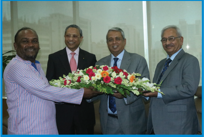
হিল প্লান্টেশন লিমিটেডের সম্মানিত পরিচালকদের ফুলেল শুভেচ্ছা প্রদান