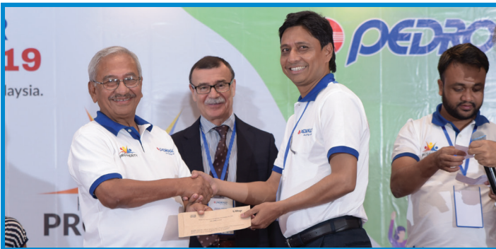
লটসরী বিজয়ীদের পুরস্কার প্রদানের মুহূর্ত