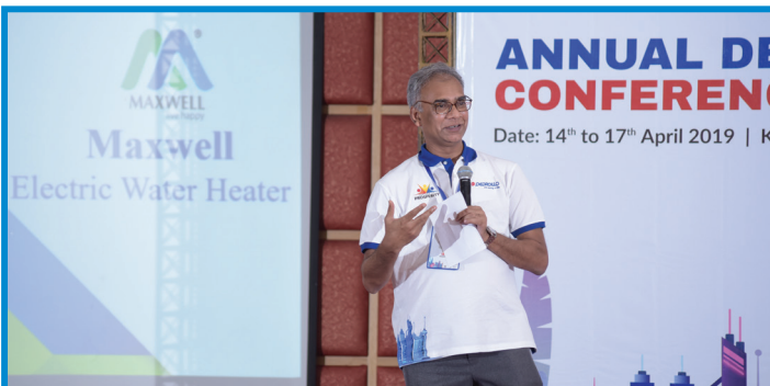
ম্যাক্সওয়েল ওয়াটার হিটার প্রসঙ্গে হেড অব সেলস্