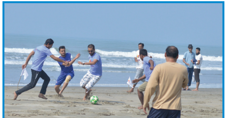
বিচ ফুটবল টুর্নামেন্ট