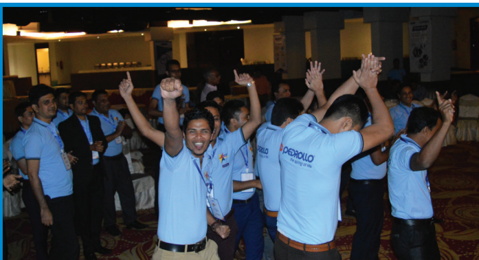
সম্মেলনে আনন্দঘন মুহূর্তে ব্যবস্থাপকরা