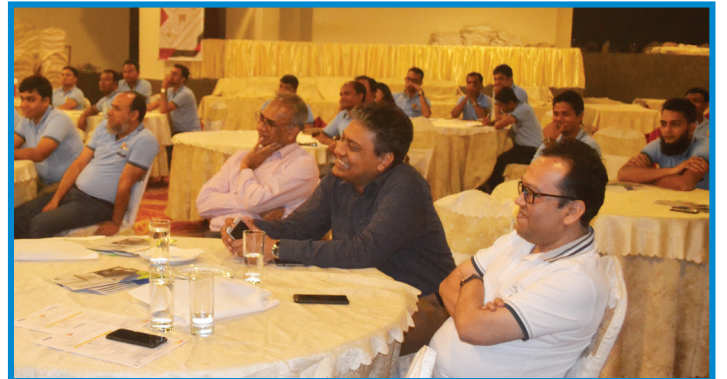
সম্মেলনে প্রতিষ্ঠানের উর্ধ্বতন কর্মকর্তাগণ