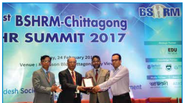
বাংলাদেশ হিউম্যান রিসোর্স ম্যানেজমেন্ট ফোরাম হতে স্বীকৃতি গ্রহণ