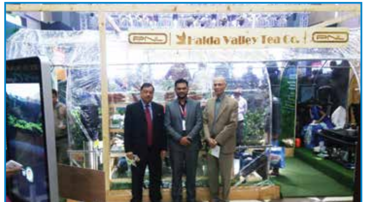
বাংলাদেশ চা প্রদর্শনী ২০১৭ তে হালদা ভ্যালির অংশগ্রহণ