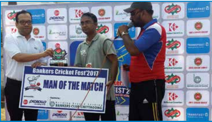
ব্যাংকার আয়োজিত ক্রিকেট টুর্নামেন্টে পেডরোলোর পৃষ্ঠপোষকতা