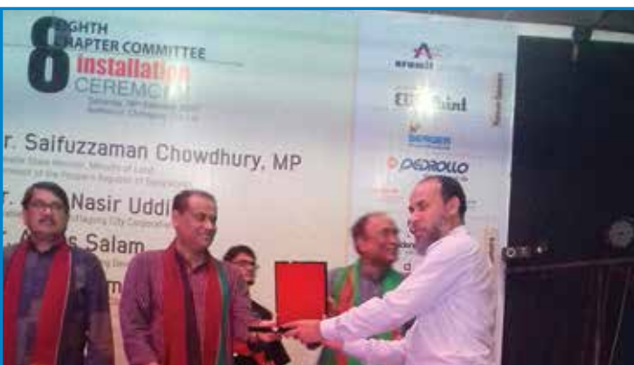
আর্কিটেক্টস ফোরাম অনুষ্ঠানে পেডরোলোর উপস্থিতি